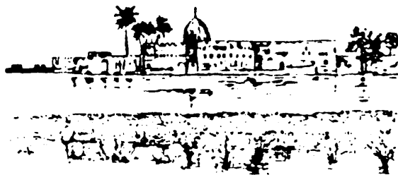
קבר עזרא הסופר שנקנה ע"י המשפחה

לְבִידַת חֲכָם וְעוֹלָם אֲשֶׁר הָיָה לְעוֹלָם אֲשֶׁר הָיָה לְעוֹלָם